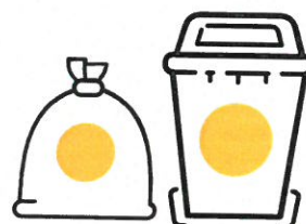
Sac / Pubela galbena